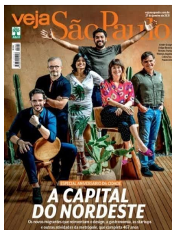
Capa da Revista Veja São Paulo da Edição 2722